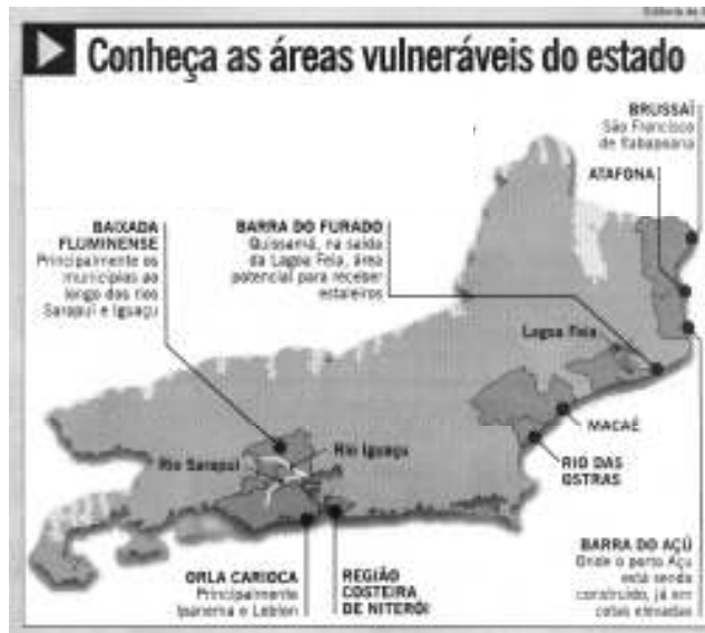
(AUTRAN, Paula. Baixada é área vulnerável a mudanças climáticas. O Globo , Rio de Janeiro, 9 ago. 2008, p. 19.)

Com base nas informações do mapa e em conhecimentos de geografia física, os ecossistemas que NÃO são considerados áreas vulneráveis à mudança climática são os situados: